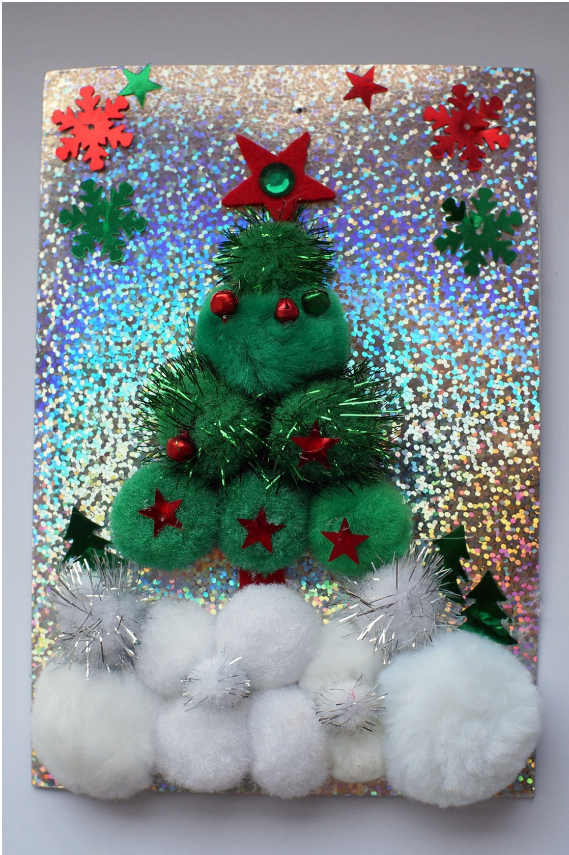
Błażej Wrona klasa IV